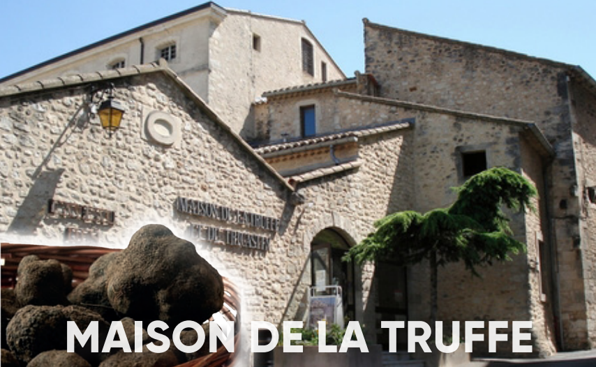
MAISON DE LA TRUFFE