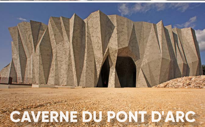
CAVERNE DU PONT D'ARC